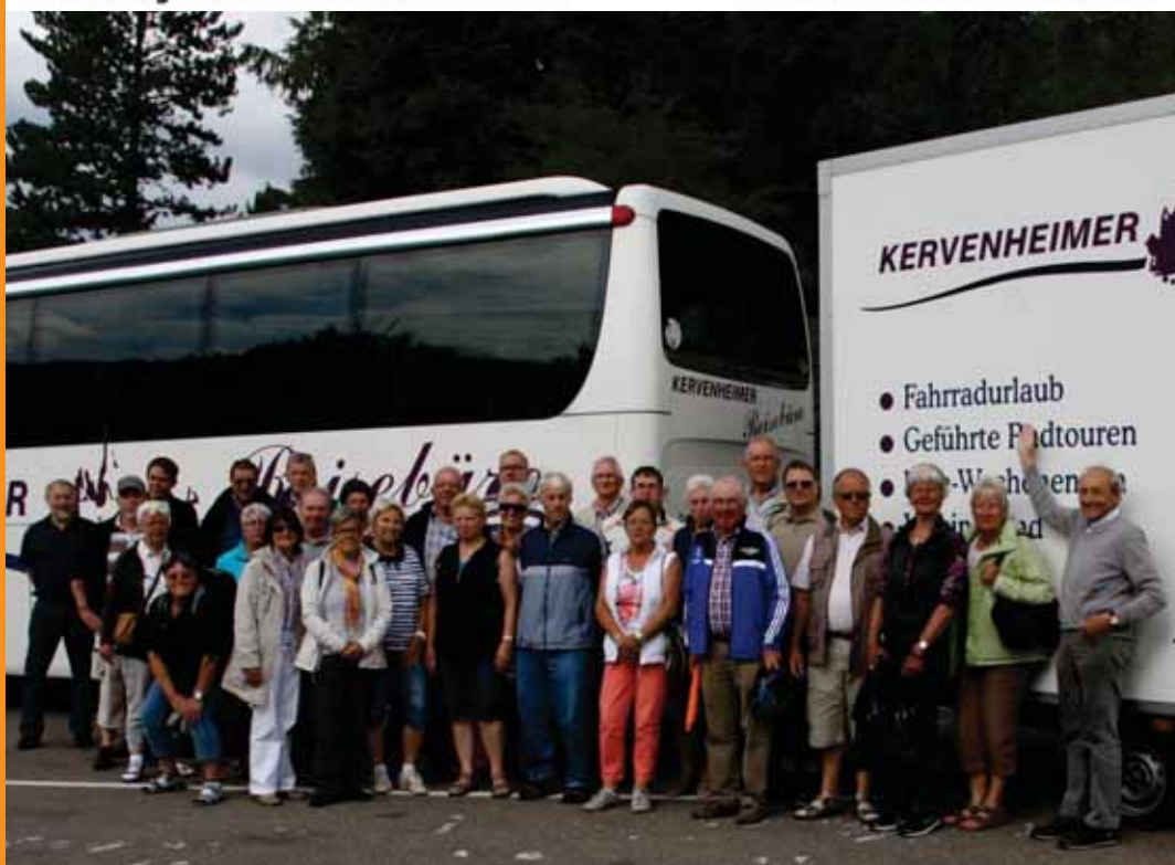
TSV Weeze unterwegs